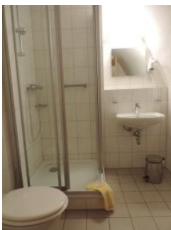
1 of 2-persoonskamer met douche en toilet

Voorzieningen: een rolstoelvriendelijk accommodatie. Alle kamers met eigen sanitair en WIFI.